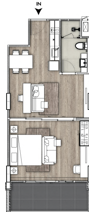
1卧室 面积约 56 平方米