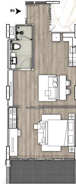
1卧室 面积约 60 平方米